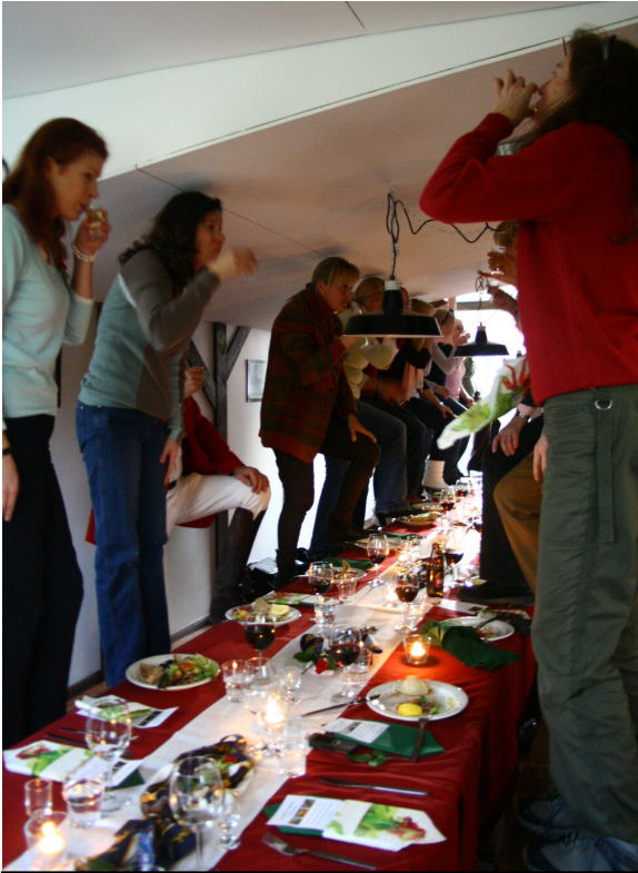
Hubertus-juhlissa nostetaan hevosenmaljoja.