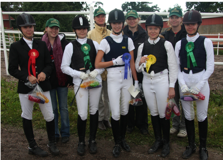
Tuntiratsastajien mestaruuskisoissa majoranilaiset ovat päässeet haastamaan itseään ja esiintyneet edukseen paitsi kentällä, myös sen ulkopuolella. Kuva Messilästä syksyiltä 2008.

Yhteistyö: Yhdessä tekemisen voima on valtava ja yhdessä olemme enemmän: jäsenet keskenään, hallituslaiset, ”rivijäsenet” ja heidän vanhempansa, seuran ja ratsastuskoulun toimijat, hevosihmiset ja hevoset. Hedelmällisen yhteistyömme avaintekijöitä ovat mm. toisen kunnioittaminen, rentous ja huumori, luotettavuus sekä hyvä tilannetaju.